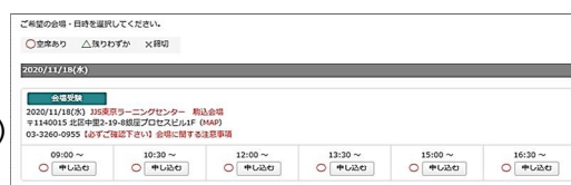
<予約画面イメージ>