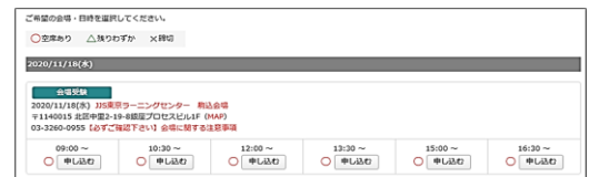
<予約画面イメージ>