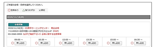
<予約画面イメージ>