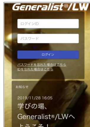
【スマートホンの場合】