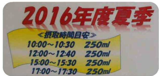
(水分補給のタイミング)