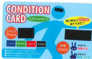
(コンディションカード)