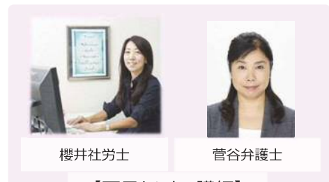
【両日セミナー講師】