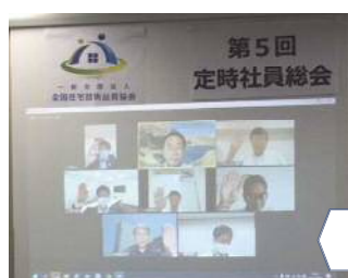
リモート開催状況