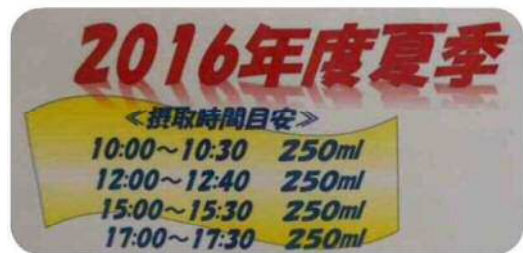
(水分補給のタイミング)