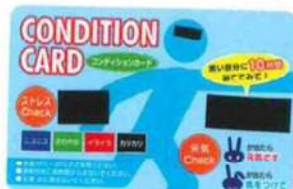
(コンディションカード)