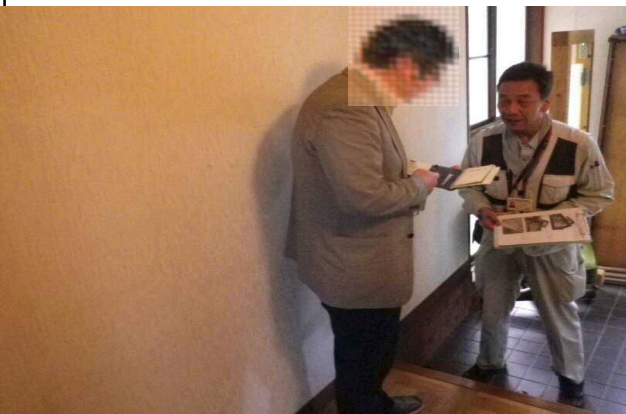
報告書(見本)を利用して写真の説明をしている